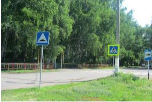
Фото на странице: 0