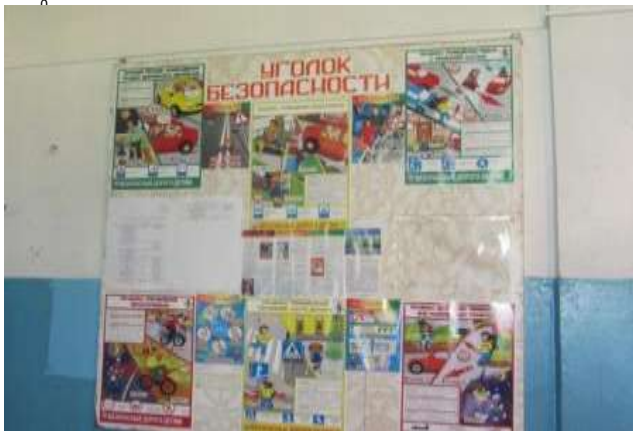
Фото на странице: 0