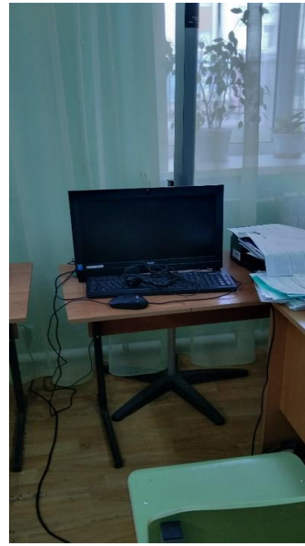
№14 – с нарушением слуха