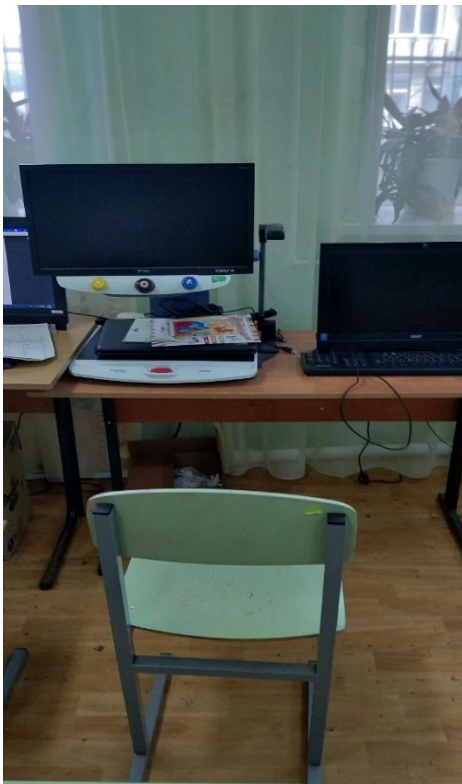
№12 – по зрению