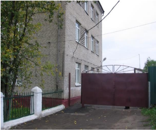
№1 Вход на территорию школьного двора