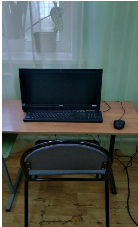
№13 – с умственной отсталостью