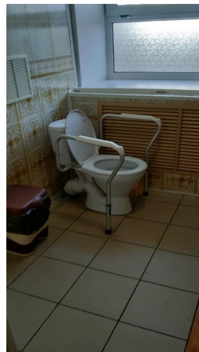
№11 Туалетная комната