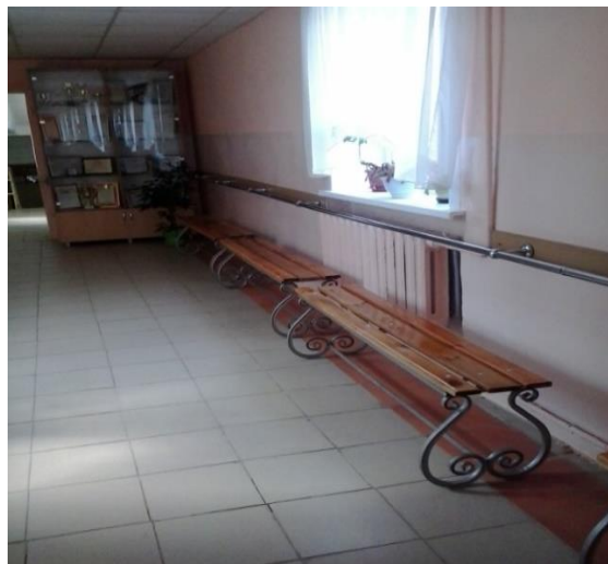
№6 Коридор (зона ожидания) с поручнями