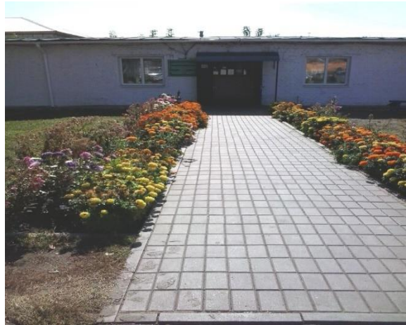
№2 Территория прилегающая к зданию