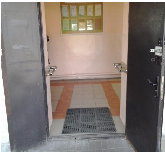
№5 Вход в школу (расширенный проем)