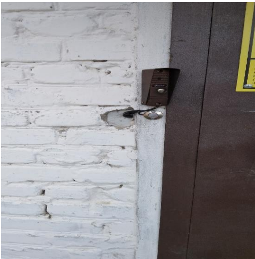
№3 Кнопка вызова дежурного