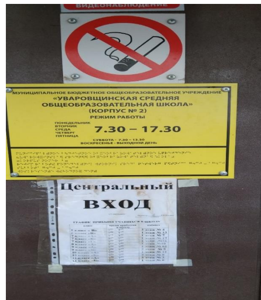
№4 Режим работы школы ( таблица Брайля)