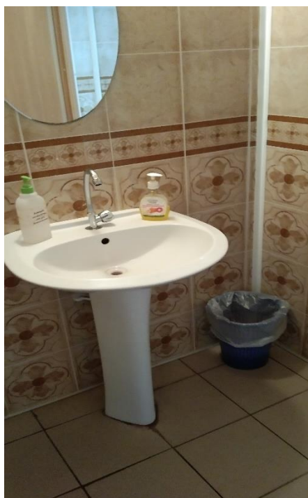
№10 Туалетная комната