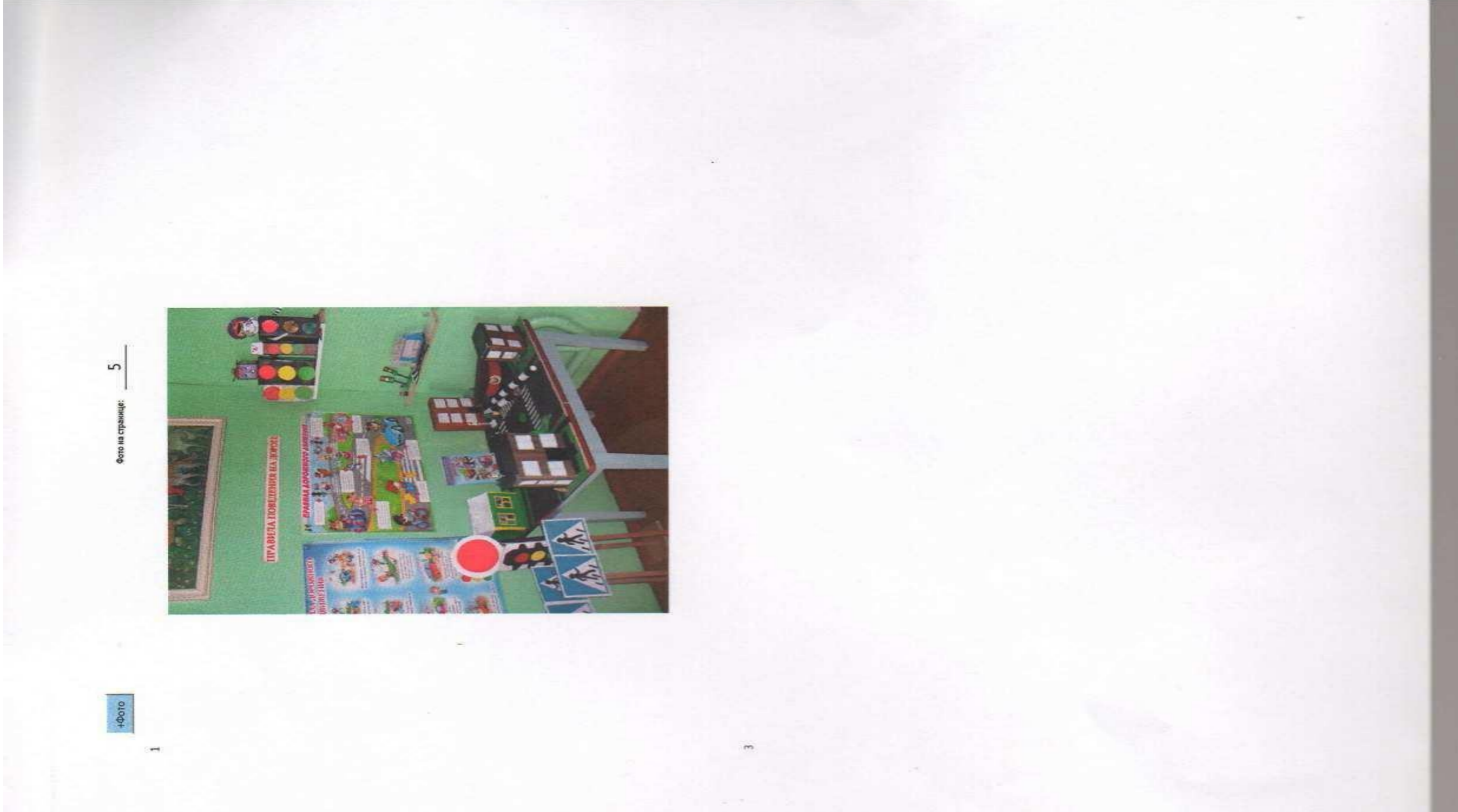
Фото на странице: 5