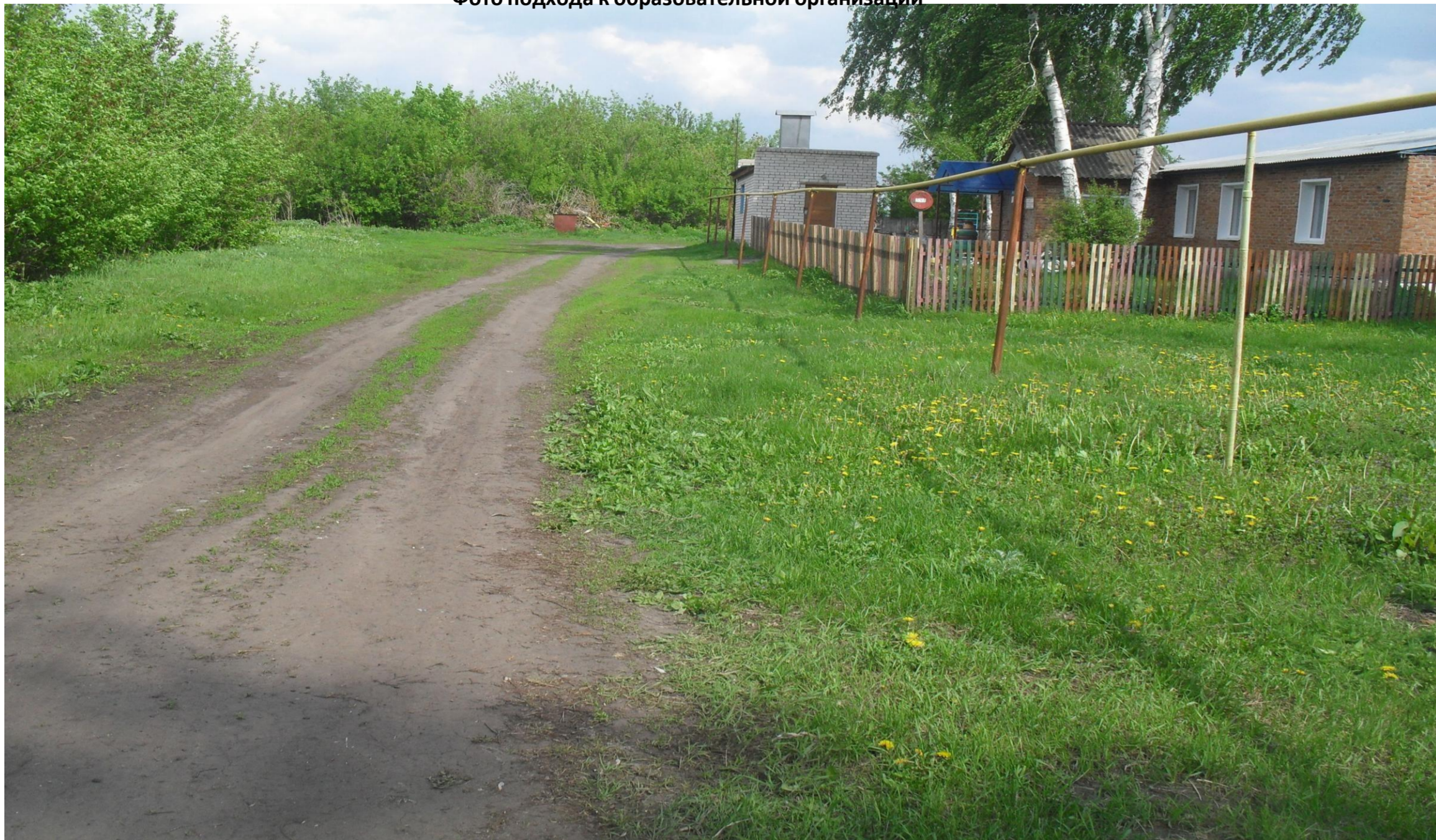
Фото на странице: 1